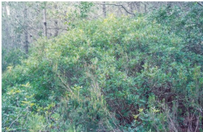
Pistacia lentiscus (Bosques de Tarragona)

Es una especie mediterránea, asociada al encinar en sus formas degradadas. Se extiende en los matorrales y bosques clareados desde el litoral al encinar de montaña. Disminuye su abundancia a medida que aumenta la altitud. En las zonas costeras el lentisco y el palmito son inseparables. Se obtiene resina de la hoja para adulterar "sumach".