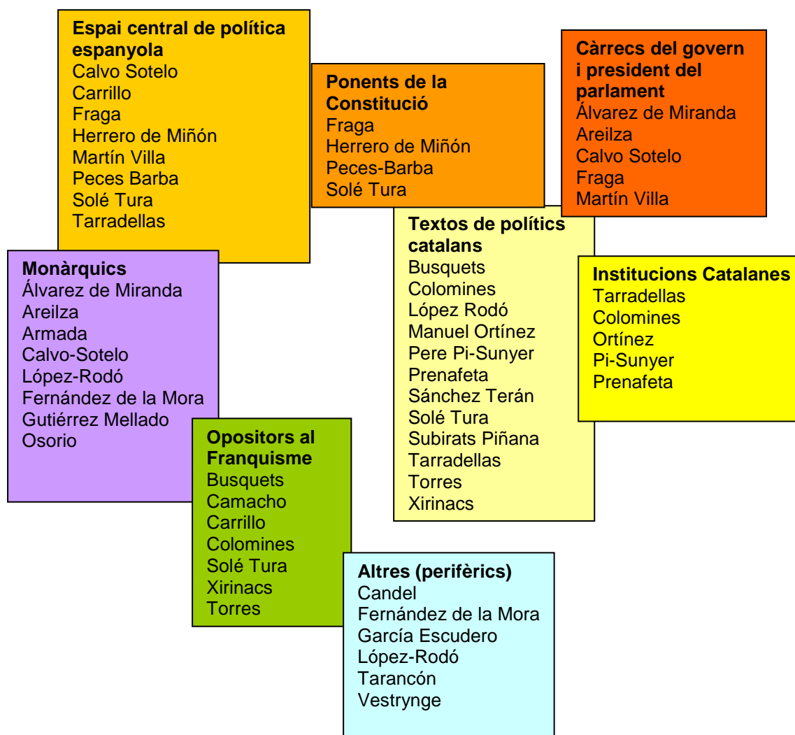
Gràfica 3. Perfil dels càrrecs en relació a la centralitat de la política espanyola i catalana en la Transició