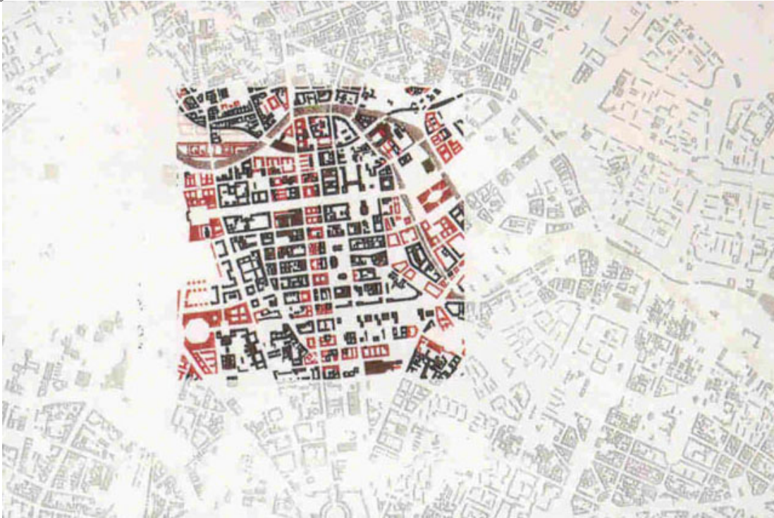
IBA de Berlín. Plano del ayuntamiento para el área sur de Friedrichstadt. Observar la cuestión figura fondo y como el plano reconstituye en rojo la ciudad del 1900.

propuesta de centro de manzana. Contrapuesto a este diseño purista aparece el lado oriental de Berlín, una gran banda negra proponiendo lo insondable e incomprensible que podría llegar a ser el comunismo para occidente en aquel entonces. Este proyecto de manzana no fue construido, finalmente O.M.A construye muy cerca un bloque de residencias fruto ya de otro concurso>>>fig106.