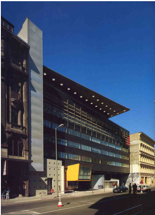
OMA. Vivienda Social para la IBA. Friedrichstadt, Sector Sur, Berlín, 1985.

Después de haber realizado un proyecto no construido para las manzanas de la IBA el grupo O.M.A. es invitado a proyectar para el mismo lugar un bloque de apartamentos integrado a la “aduana” del emblemático Checkpoint Charlie, que era el único punto de tránsito entre este-oeste.