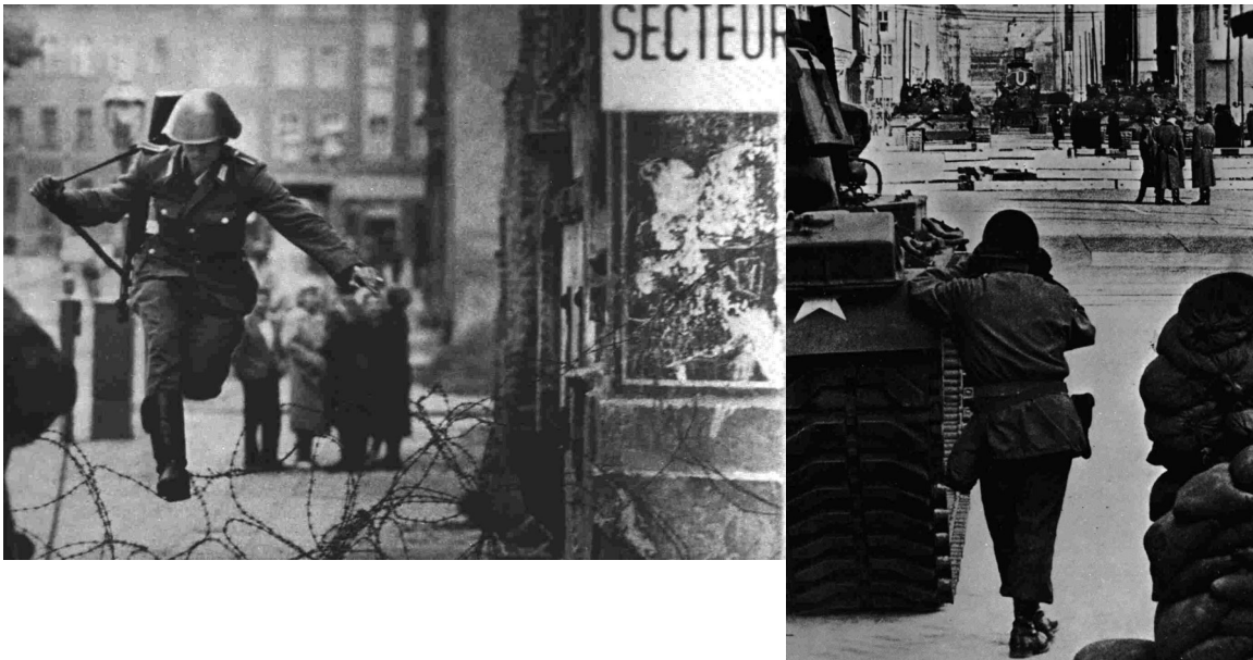
Postales sobre la problemática del muro de Berlín.

del proyecto moderno, debe ser entendido antes que como una crítica al posmodernismo en auge, sino más bien como una llamada de atención para que los arquitectos adopten una postura más comprometida con el experimentalismo y con las ideas innovadoras en las intervenciones sobre las ciudades.