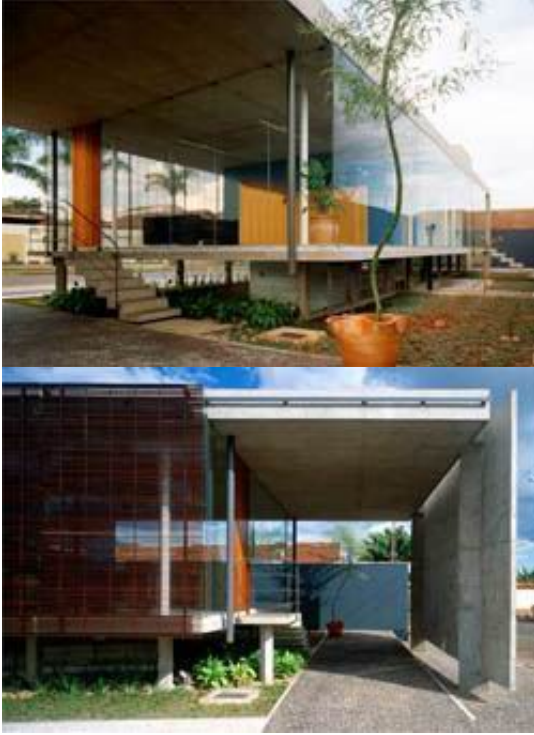
MMBB. Clínica Odontológica, Horlandia, São Paulo, 1998-2000.

Paulo Mendes da Rocha forma parte de esta nueva búsqueda sensitiva. Si bien forma parte de una antigua generación de arquitectos siempre se mantuvo aparte del discurso heroico del Movimiento Moderno brasileño. Hay una coherencia en su obra que va del brutalismo al minimalismo, siempre valorando un discurso sensitivo ligado a las formas estructurales y a la rusticidad de los materiales empleados. MMBB es una nueva generación que comenzó sus trabajos en sociedad con Paulo Mendes da Rocha. La simbiosis fue perfecta, porque MMBB dio a las últimas obras de Paulo Mendes da Rocha un aprecio por los detalles que antes no tenía. Por otra parte MMBB absorbió el discurso de imagen tan fuerte en la obra de Paulo Mendes da Rocha, claro que con un lenguaje más sofisticado tecnológicamente hablando.