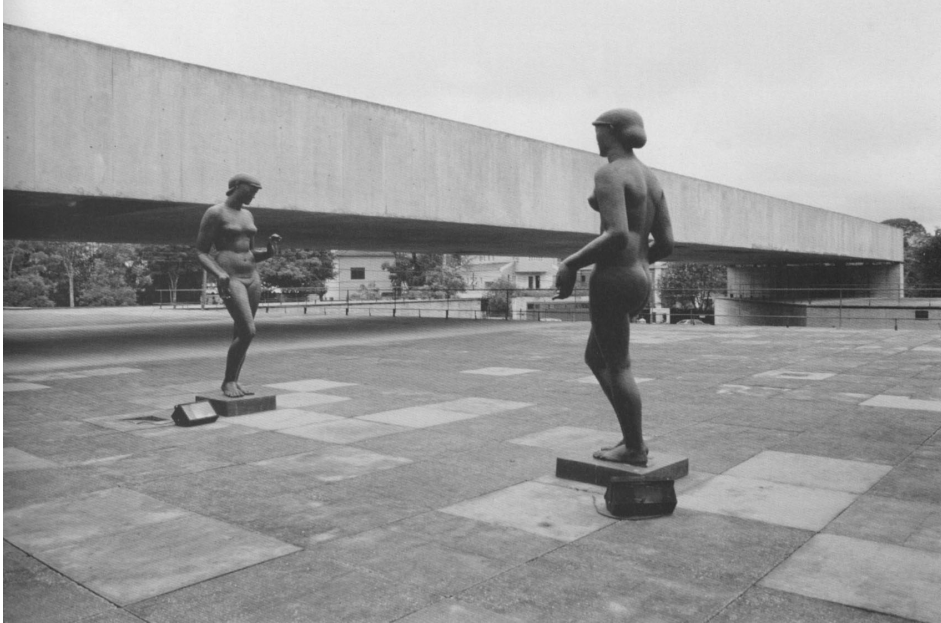
Paulo Mendes da Rocha. MUBE, São Paulo, Jardín Europa, 1987-1995. Arriba, croquis del autor; abajo

Niemeyer, de Alvaro Vital Brasil, de Eduardo Affonso Reidy>>fig44, de Jorge Machado Moreira, son únicas, son individualistas y son claros ejemplos de la búsqueda egocéntrica de este nuevo método. La excepción la encontramos en São Paulo con el trabajo académico de Vilanova Artigas. Estas reflexiones nos dejan clara la posición de que el ser moderno en Brasil fue algo así como un don que cae como un rayo desde el cielo y que no puede ser adquirido dentro de las escuelas de arquitectura brasileñas.