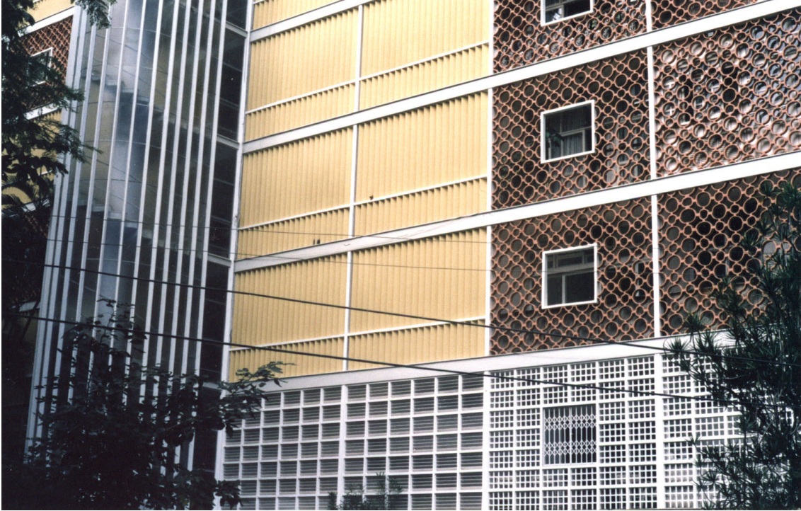
Lucio Costa. Edifício Nova Cintra, Parque Guinle, Rio de Janeiro, 1948. Imagen en 2003.

“No es mi propósito introducir aquí, (...) un 'estilo' moderno, por así decirlo enteramente listo y acabado, antes un método de enfoque que nos permita tratar un problema de acuerdo con sus condiciones peculiares. Quiero que el joven arquitecto sea capaz de encontrar su propio camino, cualesquiera que sean las circunstancias, que él cree las condiciones técnicas, económicas y sociales que le son dadas, en vez de imponer una fórmula aprendida a un ambiente que tal vez exija una solución completamente diversa. No pretendo enseñar un dogma acabado, sino una actitud ante los problemas de nuestra generación, una actitud sin condicionantes previos, original y maleable !” [mas adelante continúa] En la era de la especialización, el método es más importante que la instrucción.” 16