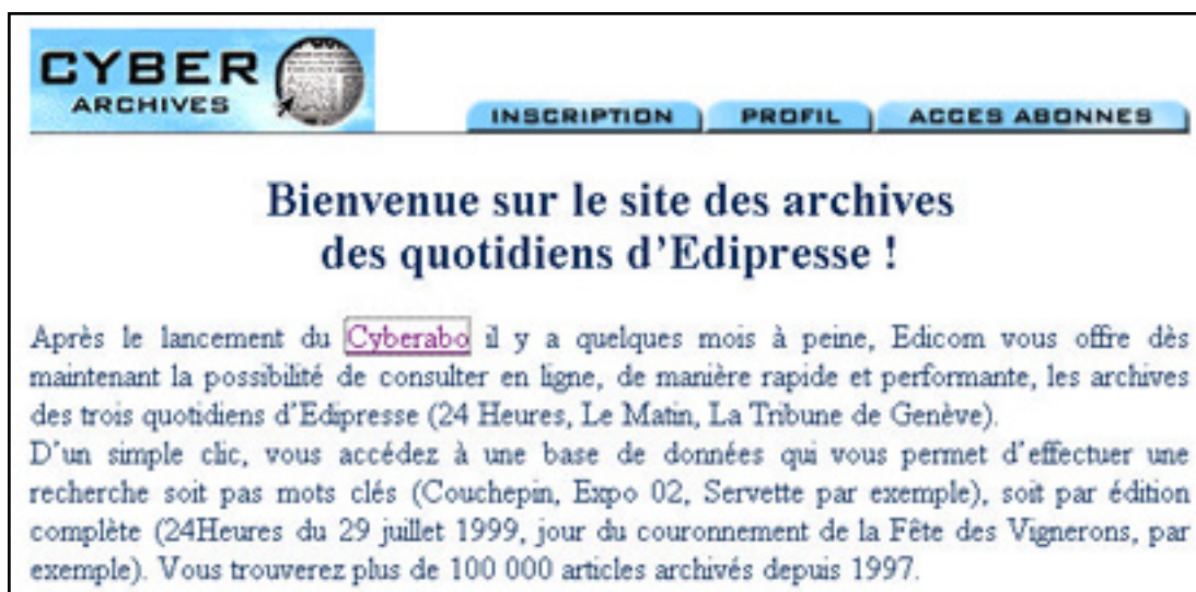
Imatge 15. Pàgina informativa de l'hemeroteca col·lectiva del grup Edipresse