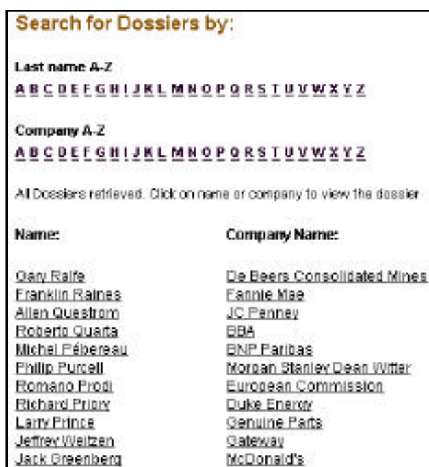
Imatge 19. Index dels dossiers de personalitats del món empresarial de Financial Times

Un bon exemple de dossiers integrats bàsicament per notícies editades pel propi mitjà, acompanyades de materials complementaris com selecció de recursos digitals sobre el tema, cronologies, mapes, etc. el constitueix el diari francès Le Monde . Financial Times (imatge 19) manté una interessant col·lecció de dossiers de companyies i personalitats vinculades al món de l'empresa i les finances que inclou, a més d'informacions publicades, dades biogràfiques i fotografies. La consulta d'aquest fons es fa, en ambdós casos, a través del browsing , seleccionant el tema, nom de la persona o empresa en un llistat.