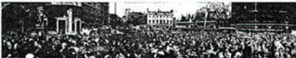
More and more demonstrators pressing forward to give their support to the 10 Downing demonstration today. (Inset: Thousands gathered in London for the demonstration.)