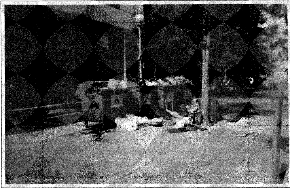
Malgrat totes les campanyes publicitàries per presentar un Raval net i verd, la imatge més habitual dels contenidors de la brossa és la d'aquesta fotografia a la plaça del Dubte (Sergi Martínez).

Per a un altre interlocutor, era sobretot molest el soroll de la gent que venia de nit al barri a sopar i de copes, gent però que no era del barri. Per altra banda, els problemes de neteja, considerava que eren responsabilitat de l'Ajuntament, que ofería un servei poc proporcionat a les necessitats del barri: