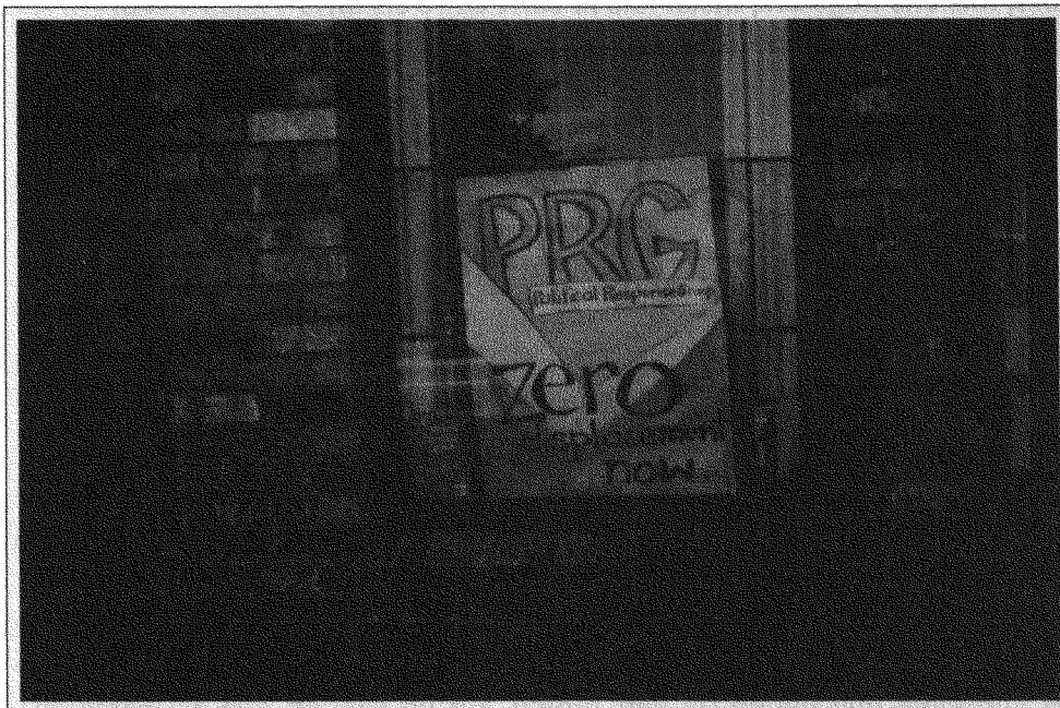
Political Response Group, grup de resistència a les expulsions dels habitants tradicionals a l'àrea coneguda com Powell Street, a la ciutat de Vancouver (Canadà) (Sergi Martínez).

Per tant, s'ha volgut saber sobre el coneixement de la realitat social del Raval dels nous residents, i també la consideració que els nous residents tenien sobre la resta de grups socials, i el grau de relació entre aquests.