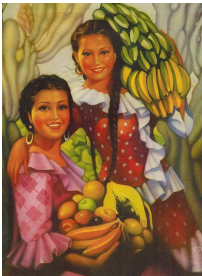
“Fruta Verde y Madura” (1939), Jorge González Camarena.