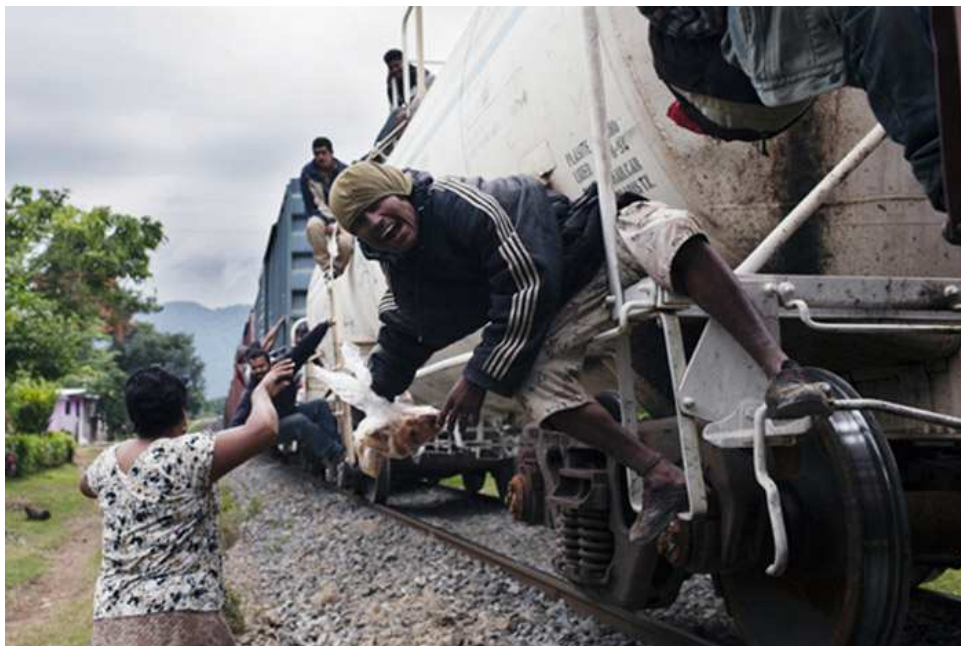
Migrantes en el tren, fotografía Markel Redondo-W SJ.