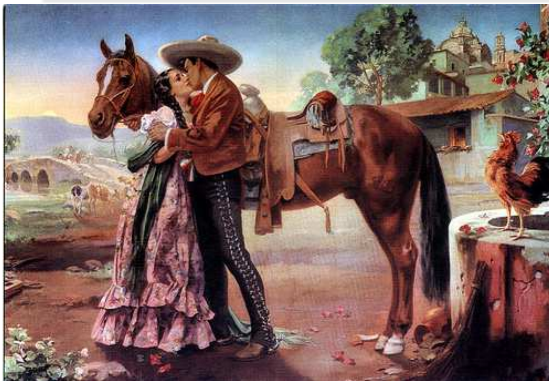
“Rayando el sol”, Eduardo Cataño Wilhelmy (fecha desconocida).