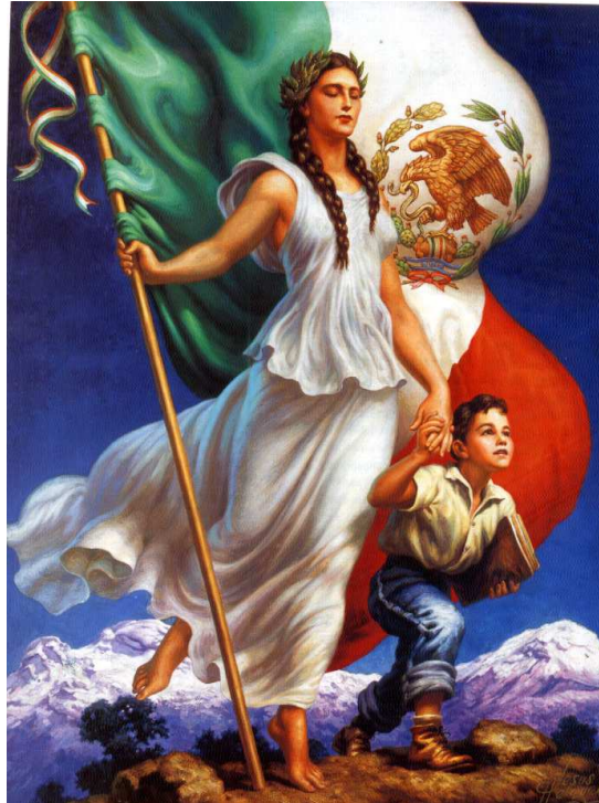
“Oh patria mía” (1963), Jesús de la Helguera.

Imágenes de los cromos que ilustran a la mujer-patria, a la “Adelita” y a la mujer mexicana.