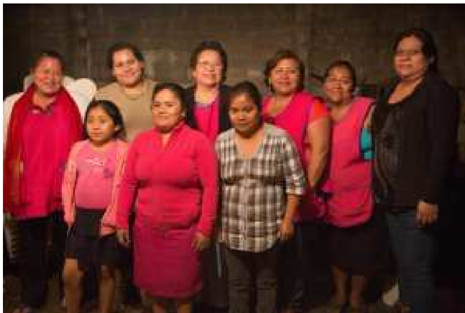
Las Patronas, celebración XX años.