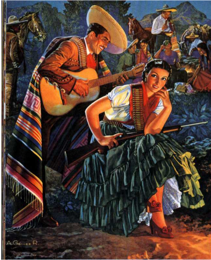
"Serenata" Antonio Gómez R. (se desconoce fecha).