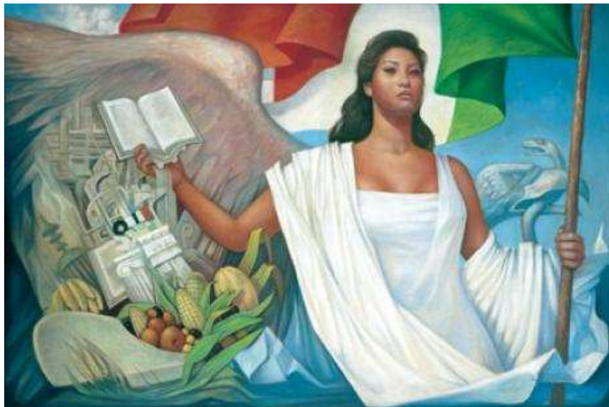
“La Patria” (1960), Jorge González Camarena.