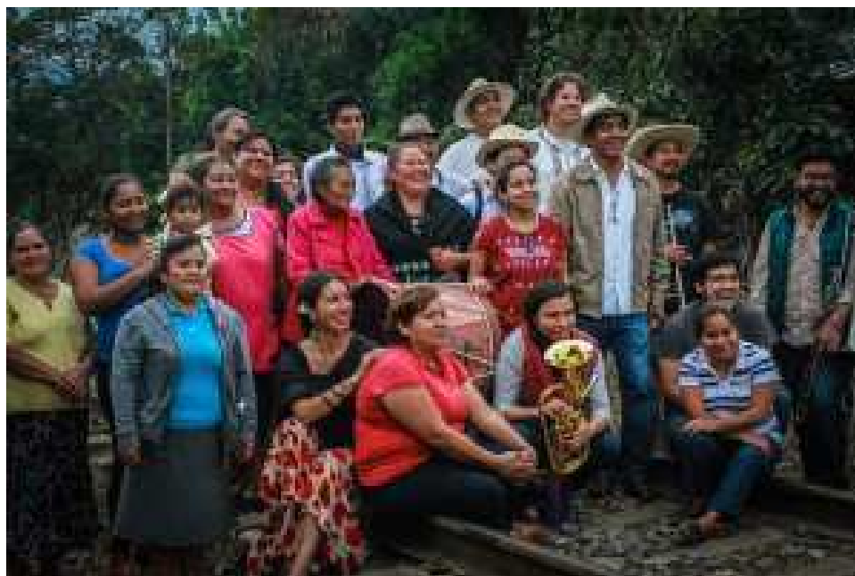
Las Patronas con los músicos, celebración XX años, fotografía de Javier García.