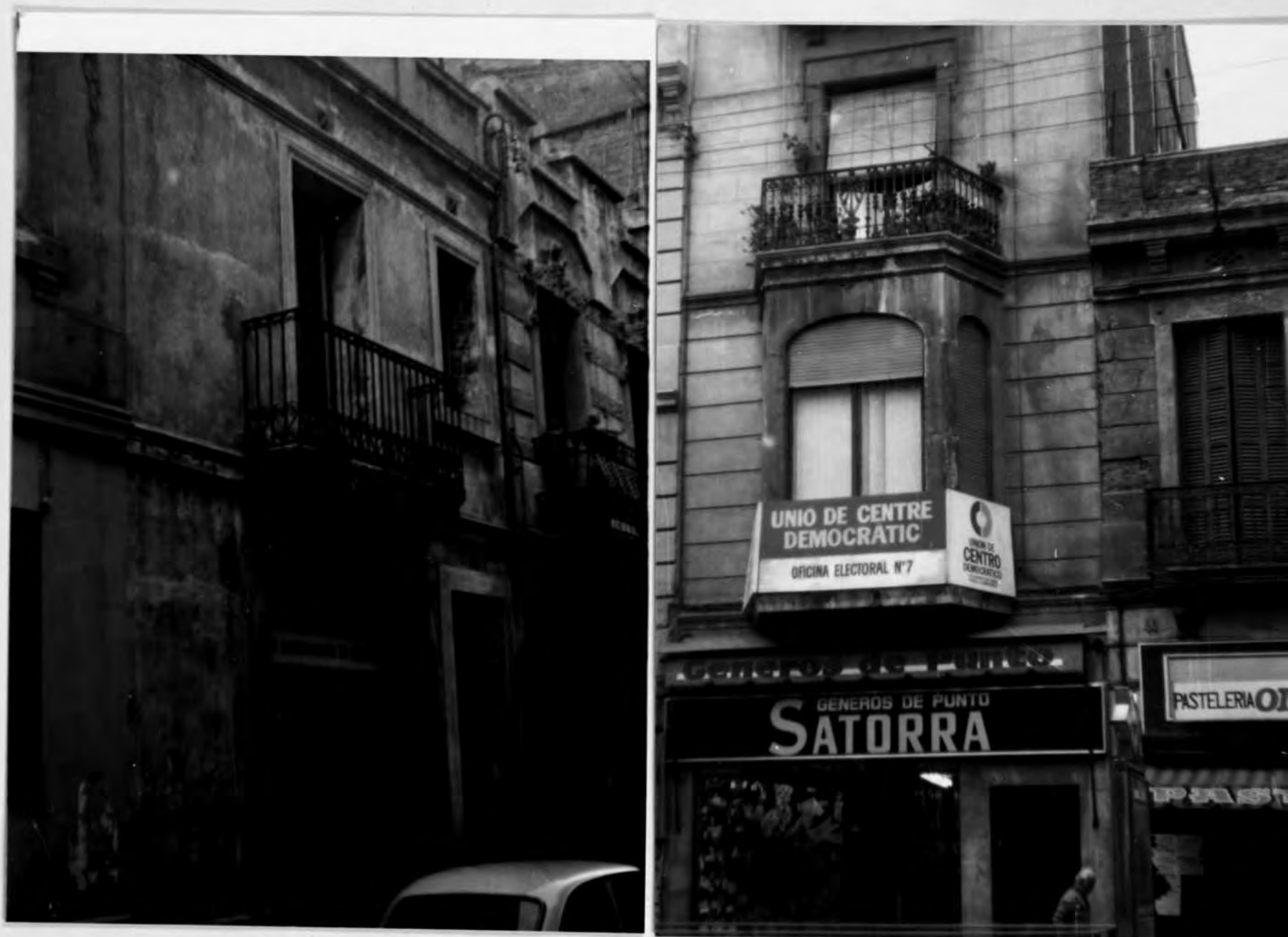
Fotos nº 22 i 23.- Les institucions santsenques avui, un contrast, la seu de l'Arxiu Històric de Sants i la del partit del govern.