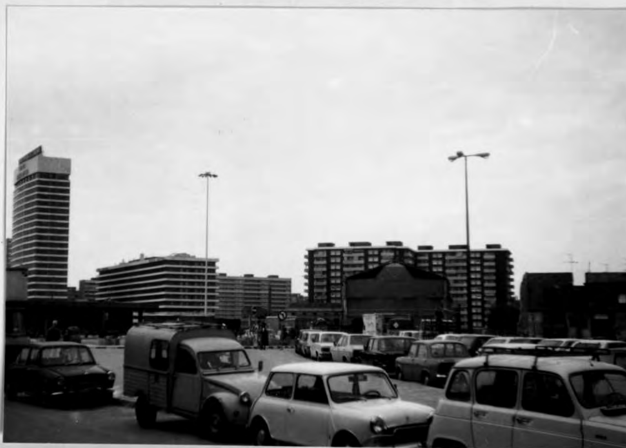
Fotos nº 8 i 9.- "La España Industrial" el 1978, enderroc i especulació.