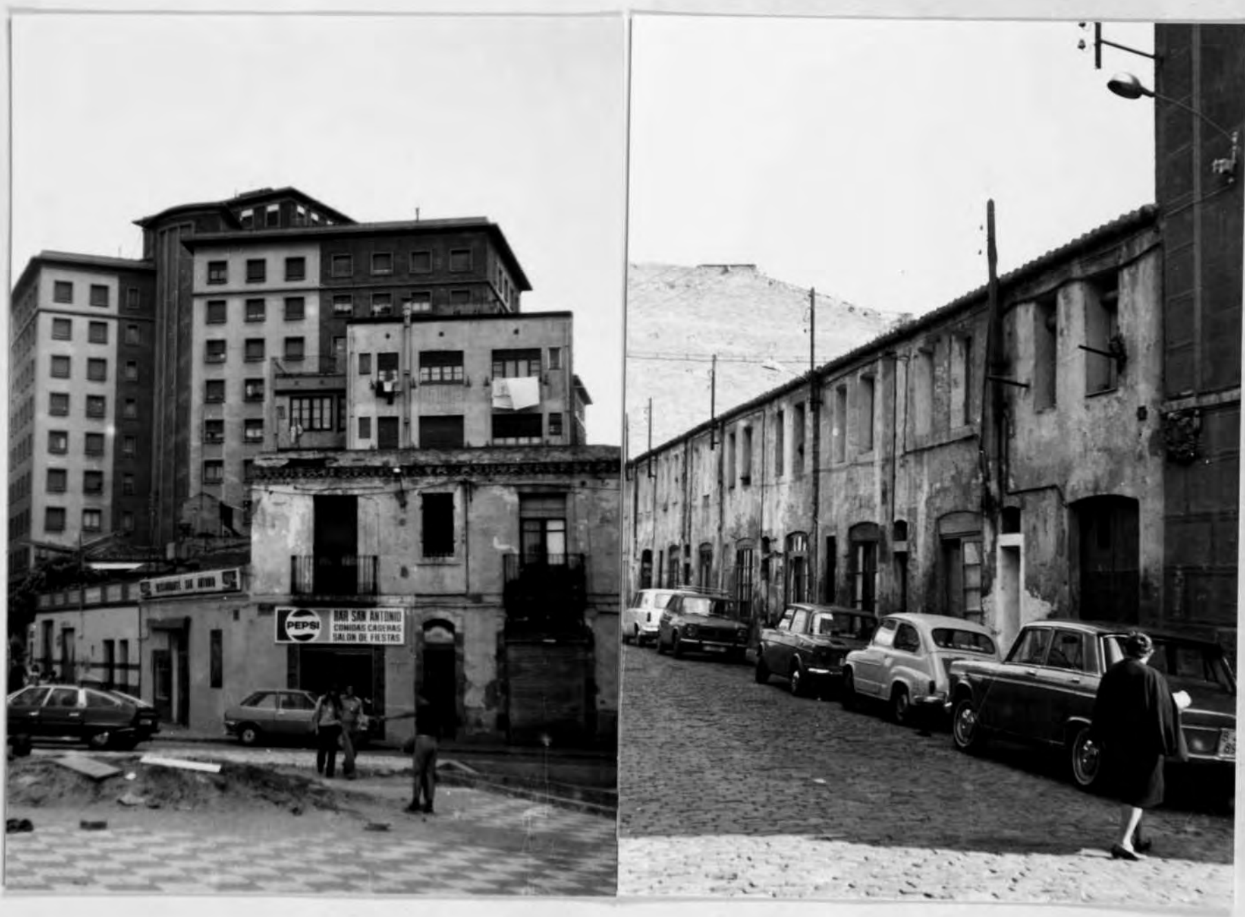
Fotos nº 20 i 21.- La casa obrera de Sants ( el carrer de Sant Antoni) i d'Hostafrancs ( el carrer del Vidriol), pervivències de poca durada.