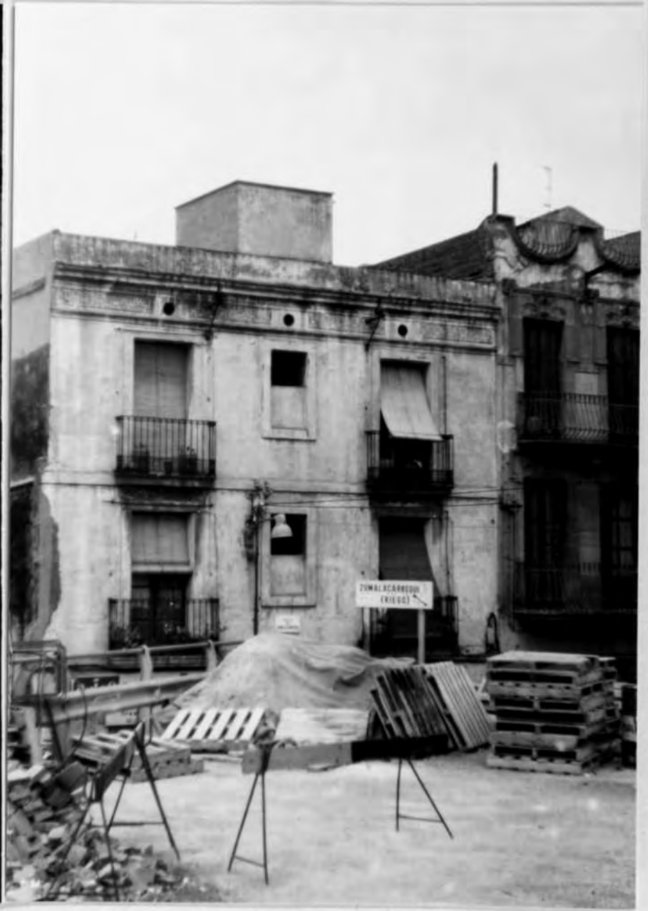
Fotos nº 18 i 19.- L'antic carrer principal de Sants avui, Zumalacárrregui-Riego, un ajuntament eclèctic.