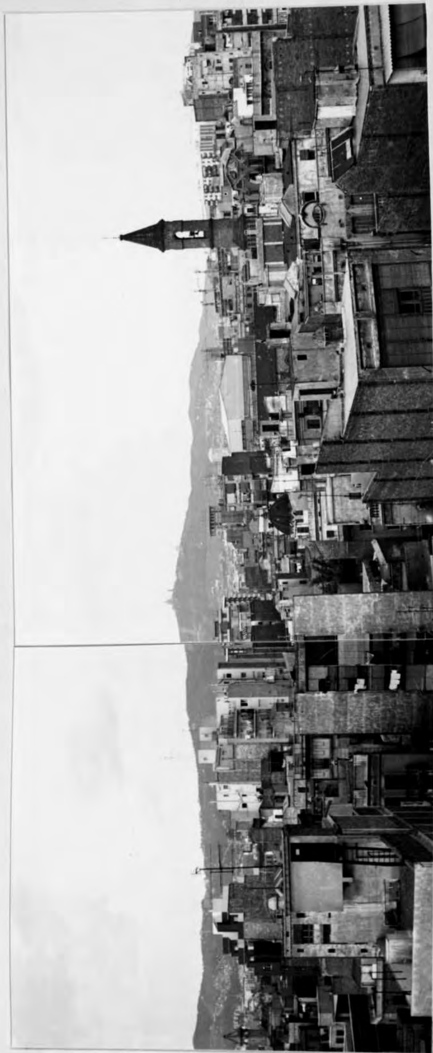
Foto nº 1.- Vista general del barri d'Hostafrancs l'octubre de 1973.