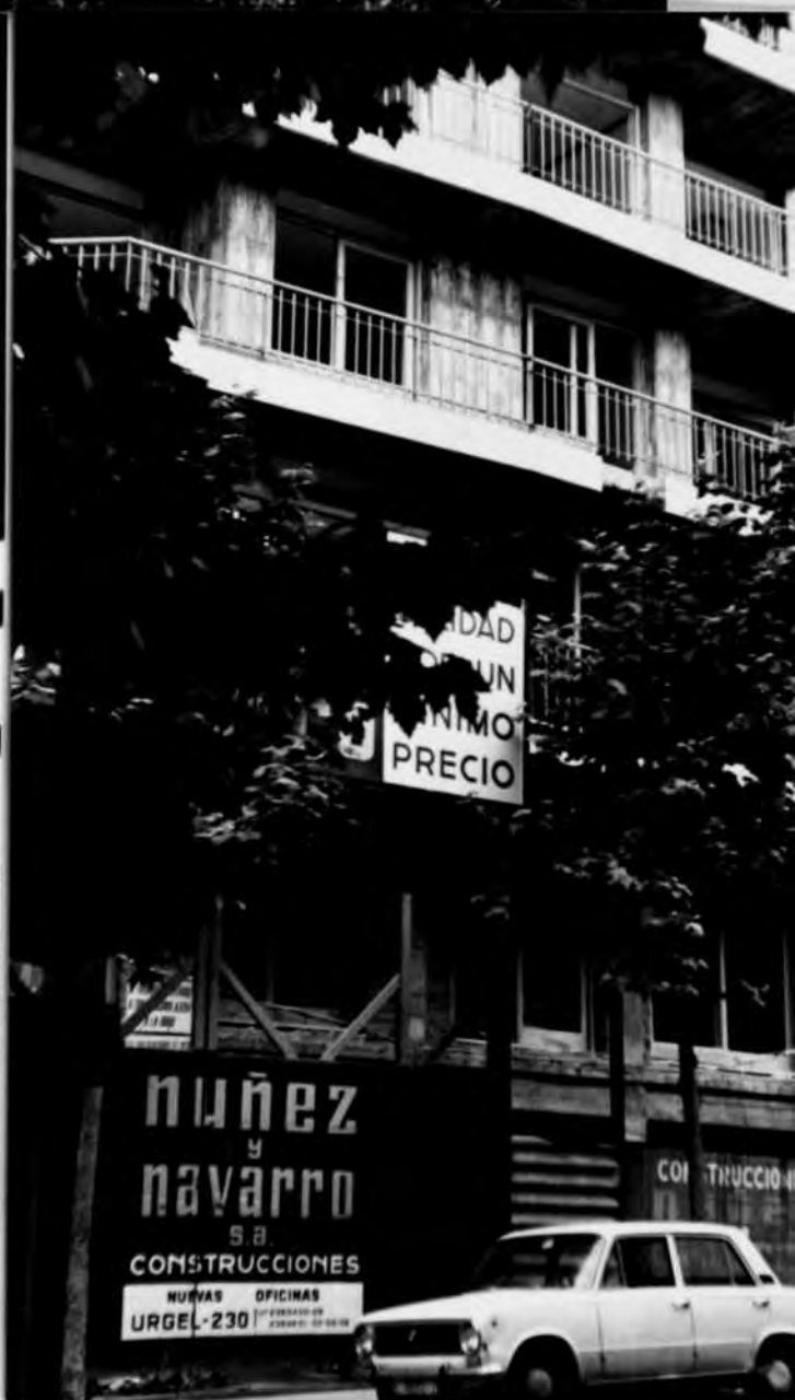
Fotos nº 3, 4 i 5. - "Núñez y Navarro" estén els seus tentacles tot Barcelona. A baix, les antigues cases de la diola i dels Santomà.