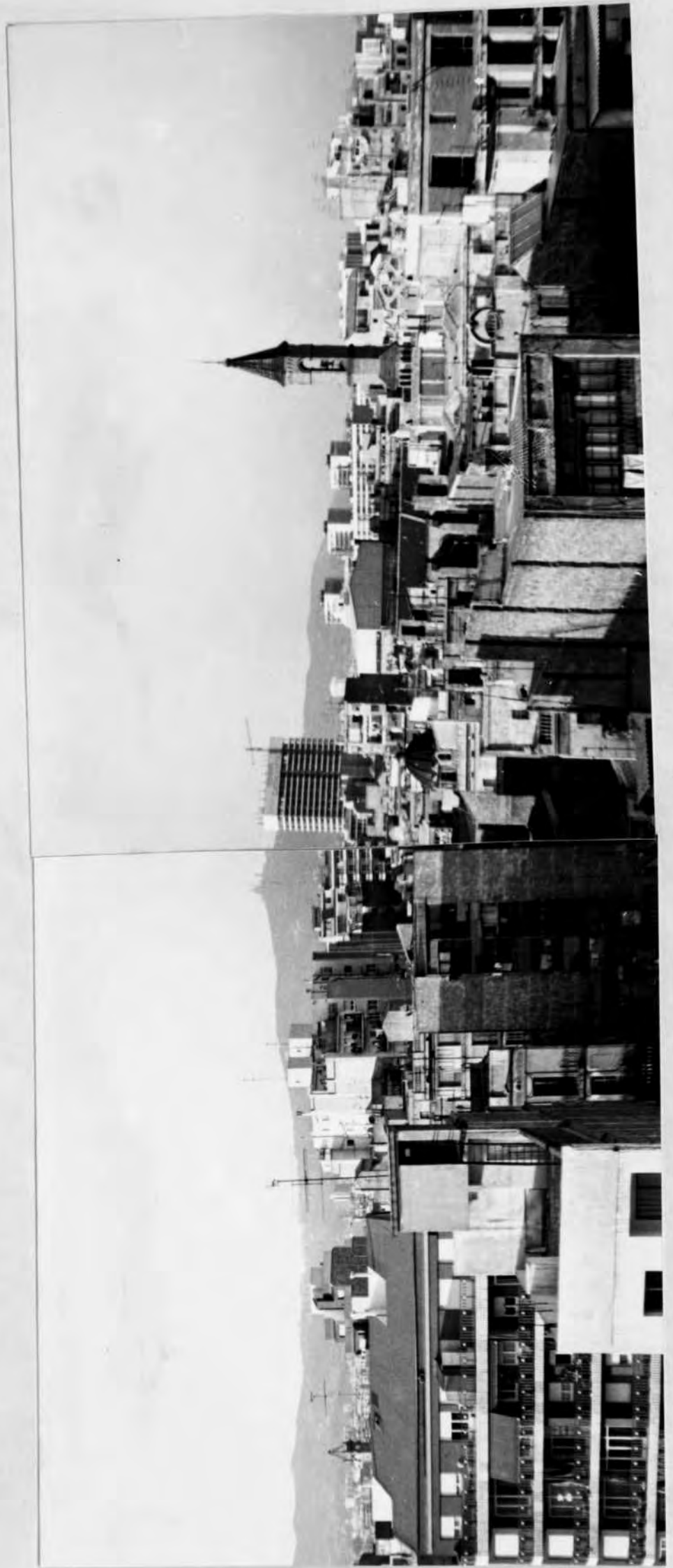
Foto nº 2.- Vista general del barri d'Hostafrancs el febrer