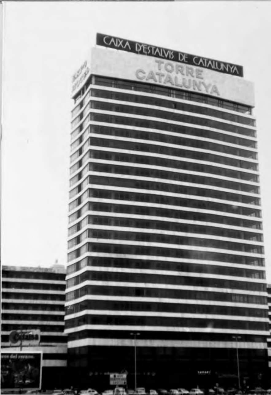
Fotos nº 13, 14 i 15.- El solar de la immobiliària-companyia d'automòbils "Motormóvil S.A." de 1973 a 1978.