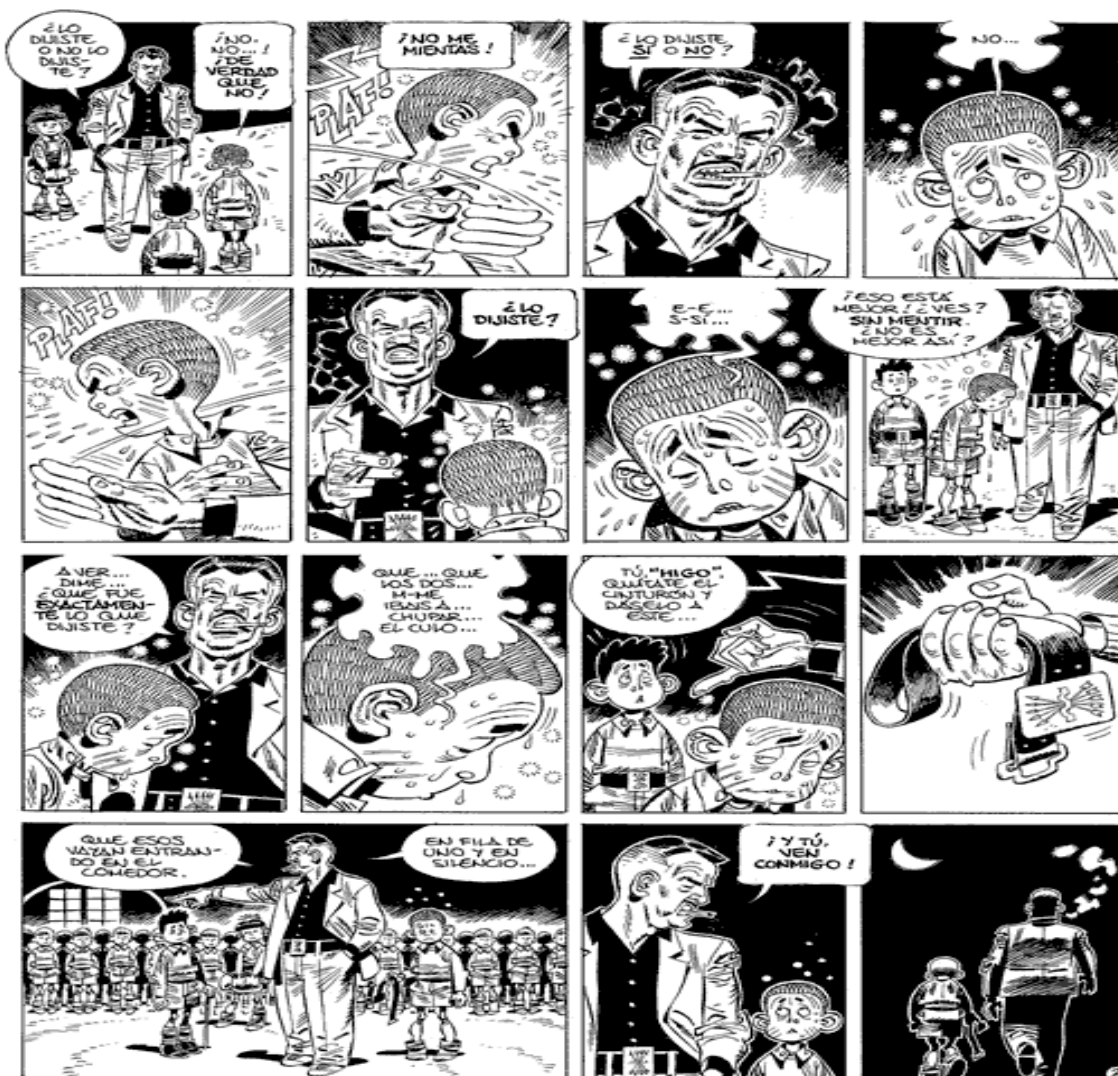
Ilustración 4: La vida en los centros del INAS. Según Carlos Giménez.

Reproducimos aquí una página con alguna de sus viñetas, que dan una idea del escenario en el que tuvieron que vivir tantos niños y niñas de la posguerra española.