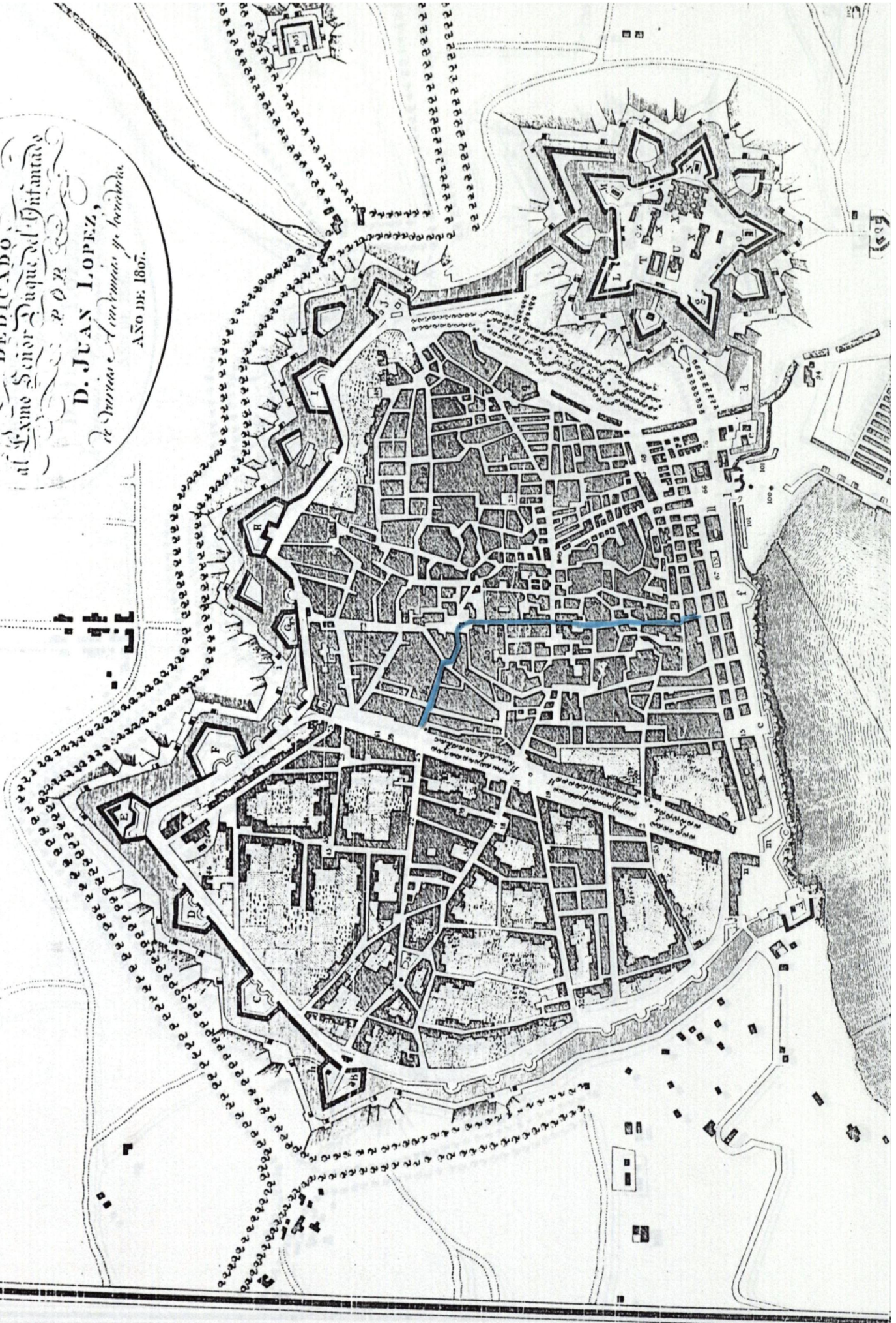
Relación de revisión de calles con fecha de 10 de agosto