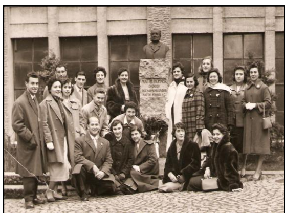
Momento en que la OCAB deposita el ramo de flores a los pies del monumento a M. HOHNER.

Salieron hacia Alemania el sábado 26 de Abril en autocar, y tras dos días de viaje, llegaron a Trossingen la noche del domingo al lunes. Tras descansar del largo viaje, al día siguiente de su llegada, la Orquesta en su totalidad fue a depositar un ramo de claveles traído desde Barcelona a los pies del monumento y lápida de Matthias HOHNER 74 , a continuación guardaron un minuto de silencio en memoria del fundador e hicieron unas instantáneas para inmortalizar tan importante momento.