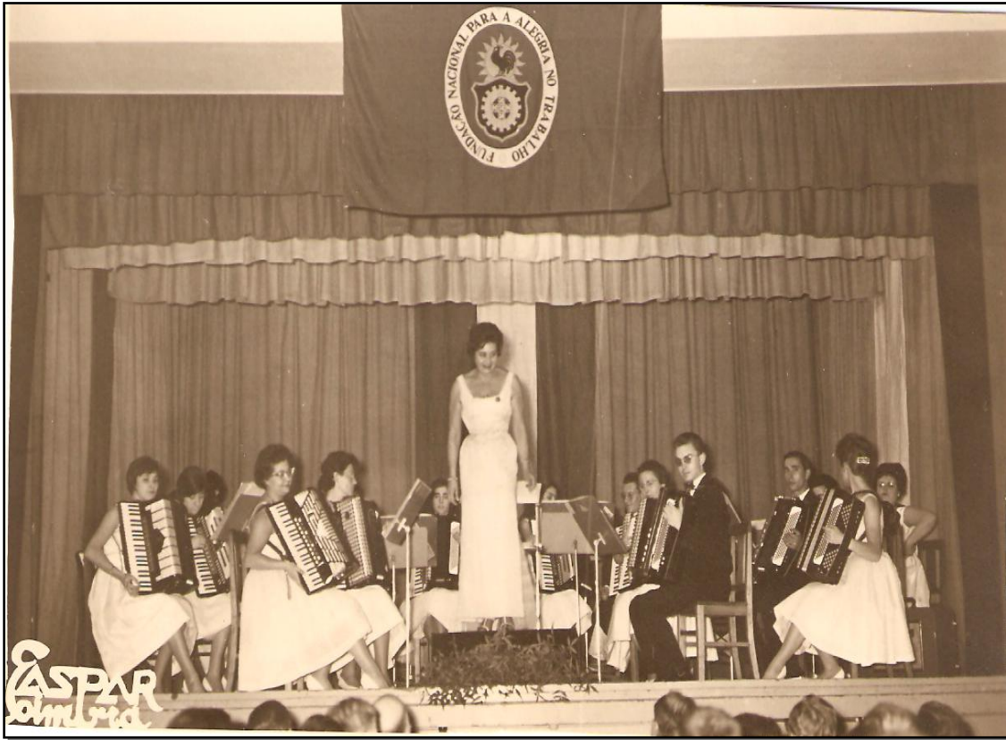
Actuación de la OCAB el 12 de Abril de 1961 en el Salón de conciertos de la FNAT.

Al día siguiente continuaron el camino hacia Lisboa. Una vez allí les esperaba una recepción ofrecida por el Embajador de España en Portugal, pero ante la cual se vieron en un aprieto tras encallarse el autocar en una de las estrechas calles de Lisboa. La única solución fue la intervención de los bomberos, gracias a la cual pudieron trasladar el autocar hasta el taller más cercano, mientras la Orquesta cogía los instrumentos y una magna caravana de taxis para poder depositar los instrumentos en el “Teatro Trindade” y trasladarse a la Embajada.