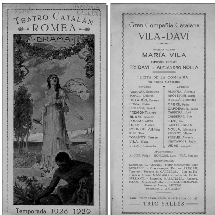
Carteles del “Trío Sellés” en el Teatro Romea de Barcelona durante la temporada 1928-29.

En aquella época era costumbre en los teatros que durante los intermedios y antes de empezar las funciones un grupo de cámara, llámese dúo, trío, cuarteto o quinteto amenizara musicalmente la espera, y con este objetivo contrató el Teatro Romea al “Trío Sellés”, el cual actuó en esta sala hasta pasada la Guerra Civil española, aproximadamente hasta el año 1941. En este periodo gozaron del reconocimiento del numeroso público que asistía al Romea, el cual premiaba sus interpretaciones con extensos y calurosos aplausos. El repertorio del “Trío Sellés” era extenso y variado, desde música de cámara de autores como Beethoven o Mozart, romanzas de zarzuelas, arias de óperas, intermezzos, canciones italianas, sardanas, obras