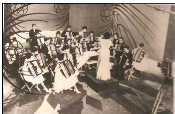
A la izquierda vemos a la OCAB actuando en el “Teatro Español” de Madrid y a la derecha actuando para el programa “Gran Parada” de TVE.

De Madrid siguieron la ruta hacia Portugal, no sin antes visitar el “Valle de los Caídos”, El Escorial, el Carmelo en Ávila, Salamanca y Ciudad Rodrigo. Tras hacer noche en esta última, al día siguiente, 11 de Abril, prosiguieron hacia su destino: Portugal. Al llegar a tierras lusas les comunicaron que el concierto de la noche tendría que efectuarse en Braga en lugar de en Oporto, con lo cual el trayecto aumentó en kilómetros. El motivo de este cambio no fue otro que la gran demanda de localidades