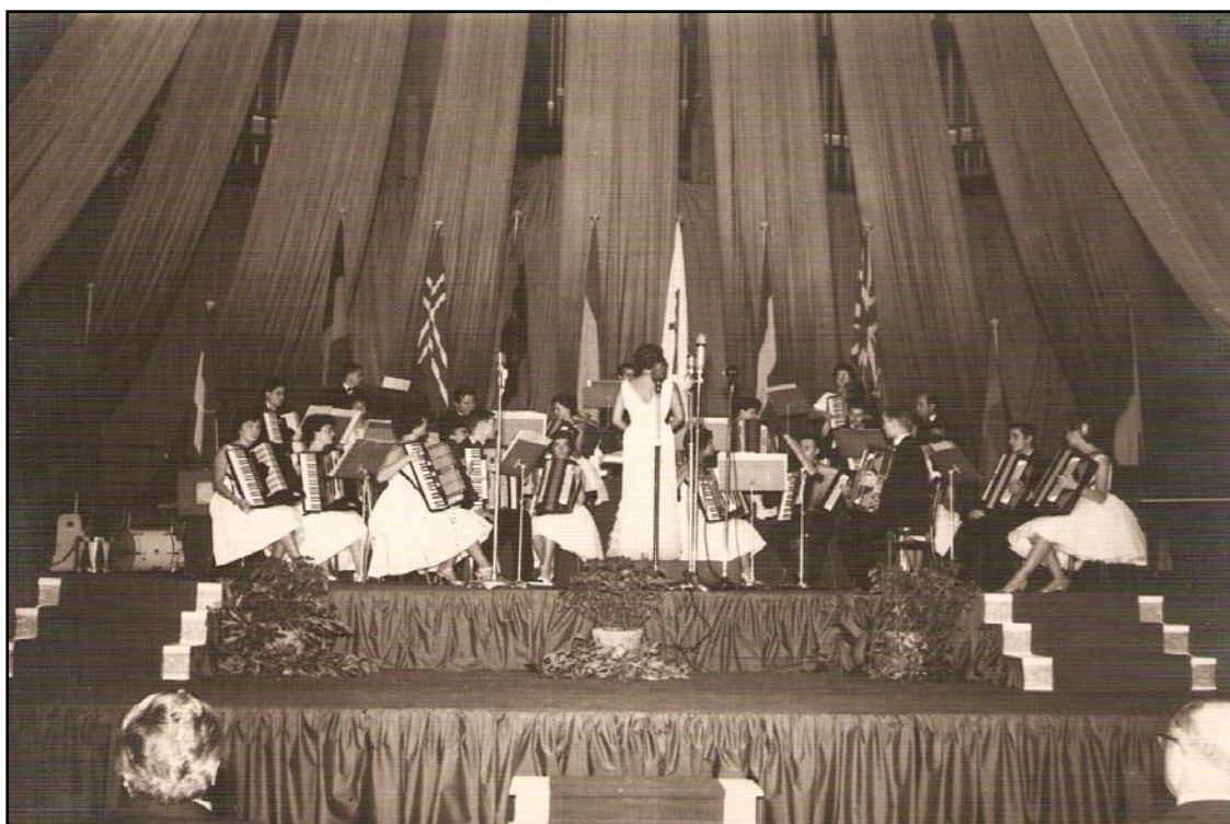
Imagen de la OCAB en la Sala Oval del Palacio Nacional de Montjuïc, en Barcelona, durante el concierto celebrado la mañana del 2 de Octubre de 1960. En esta fotografía vemos como de nuevo las féminas de la Orquesta lucían atuendo blanco.