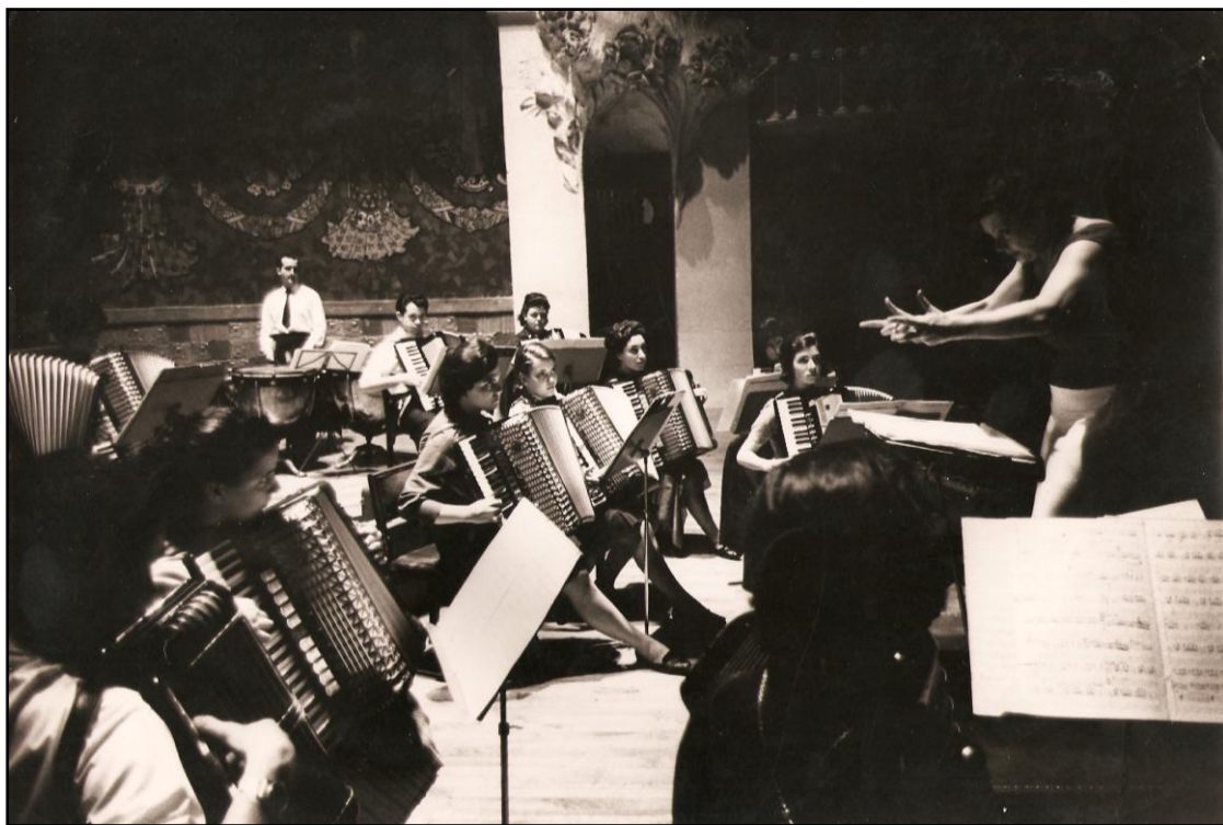
Fotografía realizada en el Palacio de la Música Catalana por el fotógrafo Oriol Maspons.

realizadas durante la simulación de un ensayo en el “Palacio de la Música Catalana”, el cual alquilaron para la ocasión.