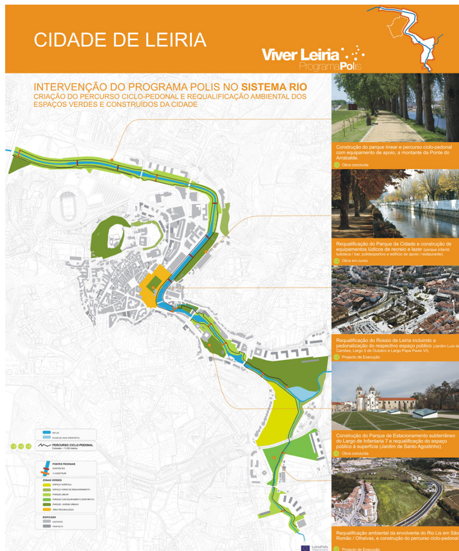
Fig. 37. Panel de presentación del Polis Leiria y el programa Sistema Rio. El proyecto preve la recuperación de algunos edificios significativos al mismo tiempo que se plantea la recuperación de la Ribera como espacio verde.

Varios de estos ejemplos, aunque en escala urbana, pueden incluirse dentro del concepto de [re]uso creativo , puesto que son proyectos de adaptación y cambio de función. Y tienen por objetivo la revitalización de la ciudad, de los espacios urbanos y no solamente de los edificios. Por ejemplo, el Programa Polis para Leiria propone la recalificación urbana y ambiental de dos de sus zonas nobles: el centro, donde ésta más se acerca a la pendiente del monte del castillo, y la zona ribereña. Se trata de una recalificación a todos los niveles, habiendo merecido los Planes de Pormenor del Sistema Río, la