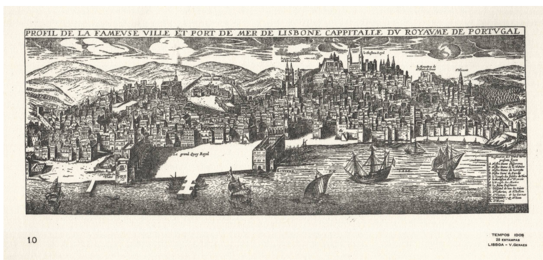
Fig. 46. Perfil de la famosa villa y puerto de mar de Lisboa, Capital del Reino de Portugal. Sin Fecha Podemos ver la importancia de los conventos, las iglesias y sus torres, de los cuales están debidamente señaladas en el grabado San Vicente y el Monasterio de Santa Maria de Graça, así como el "Gran Templo". Designados por letras, difíciles de distinguir en el grabado, tenemos: A) Nª Sra. de la Esperanza, B) Nª Sra. de la Victoria, C) Nª Sra. de Loreto, D) ilegible, E) Templo de los Hijos de Dios, F) Convento de San Francisco, G) Templo de los Mártires, H) ilegible, I) Hospital de Todos los Santos, L) Santa Catarina, M) ilegible, N) Santo Tomas, O) El Carmo, P) ilegible, Q) ilegible y R) San Pedro.

Los primeros conventos se asentaron en la ciudad en el siglo XIII, tanto en el centro como en las colinas. Desde ahí, fueron fundándose conventos y monasterios de diversas órdenes religiosas, en diferentes zonas e alrededores de la ciudad que por entonces no ocupaba la extensión actual.