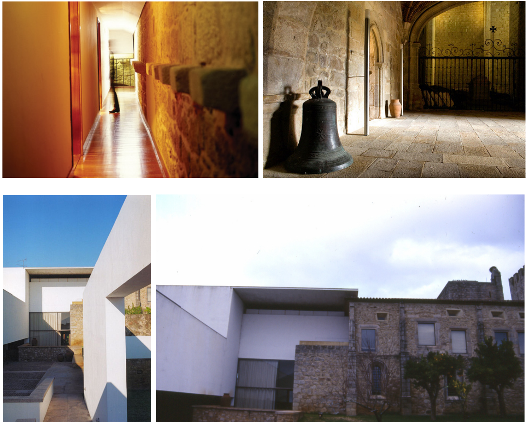
Fig. 42, 43, 44, 45. Parador de la Flor de Rosa, antiguo convento en Crato. Proyecto de João Luis Carrilho de Graça. La intervención introduce elementos contemporáneos pero es respetuosa con lo existente.

También podemos mencionar la reutilización de la “Casa dos Bicos”, originalmente una especie de palacete pequeño en la zona baja de Alfama, en lo que se podría denominar como un espacio cultural. Después de ser utilizado como Aduana, fue recuperado para servir de Sede a Comisión Nacional para las Conmemoraciones de los Descubrimientos Portugueses y albergó una exposición de material referente a dichos descubrimientos. Esta intervención fue bastante radical, pues aumentó el edificio en 2 pisos que no existían, la fachada posterior desapareció a favor de una fachada en vidrio completamente ajena al contexto, y no hay rastro de la planta original. Actualmente, el edificio está cerrado, sin función aparente pues dicha comisión fue extinta y no se le atribuyó otra utilidad.