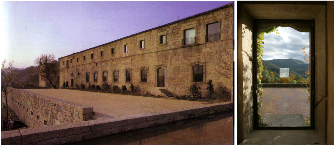
Fig. 38, 39. Parador de Santa Maria do Bouro, proyecto de Souto de Moura. La cobertura de teja se retiró para dar espacio a una cobertura jardín que se integra mejor con el paisaje circundante. La introducción de materiales y elementos contemporáneos es menos notoria en el exterior.

Nora”, proyecto de Duarte Nuno Simões inaugurado en 2003; o el proyecto de Carrillo de Graça para el parador de Flor de Rosa en Crato (Fig. 40, 45).