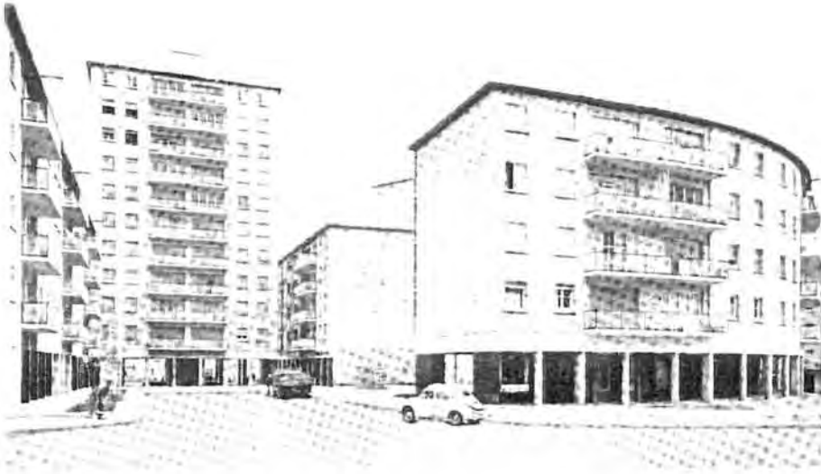
Figura 12.1. Manzana nº 11 del barrio VCE-Can Ros. Se observan espacios abiertos entre los edificios, que permiten una mejor conectividad y la existencia de plazas para uso cívico.