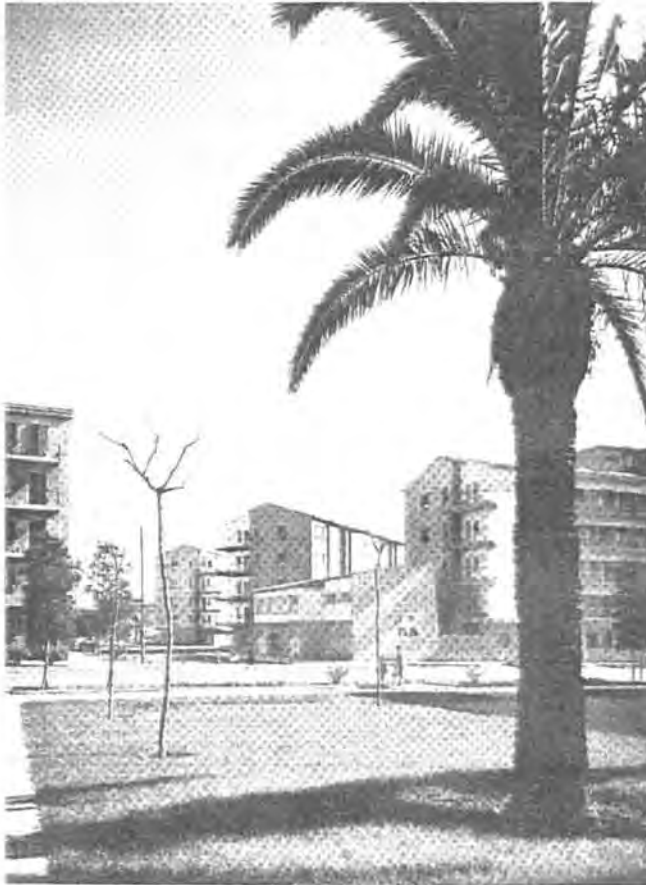
Figura 12.2 En el barrio VCE-Can Ros se diseñaron ya de origen numerosos espacios verdes entre las manzanas de los edificios.