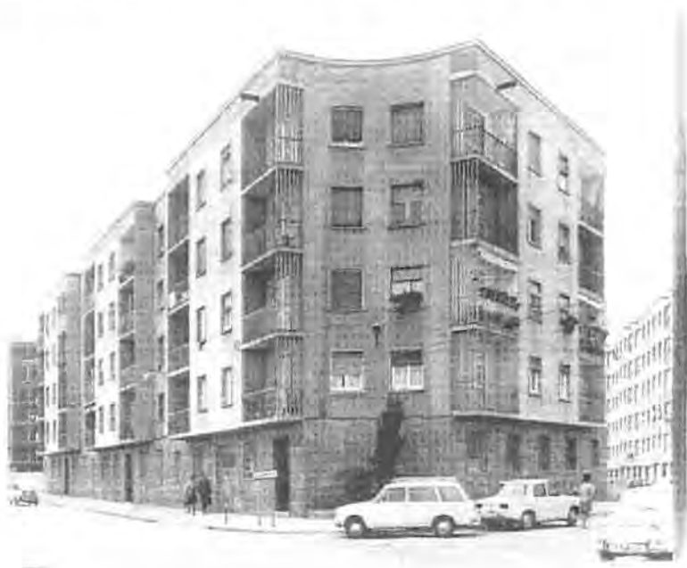
Figura 11.1. Grupo Pío X construido en Hospitalet de Llobregat por Viviendas del Congreso Eucarístico.

El proyecto fue realizado por la empresa Construcciones y Obras Carbonell y firmado por los arquitectos Manuel Puig Janer y Carlos Marqués, con la colaboración de los aparejadores de VCE (Figura 11.1.).