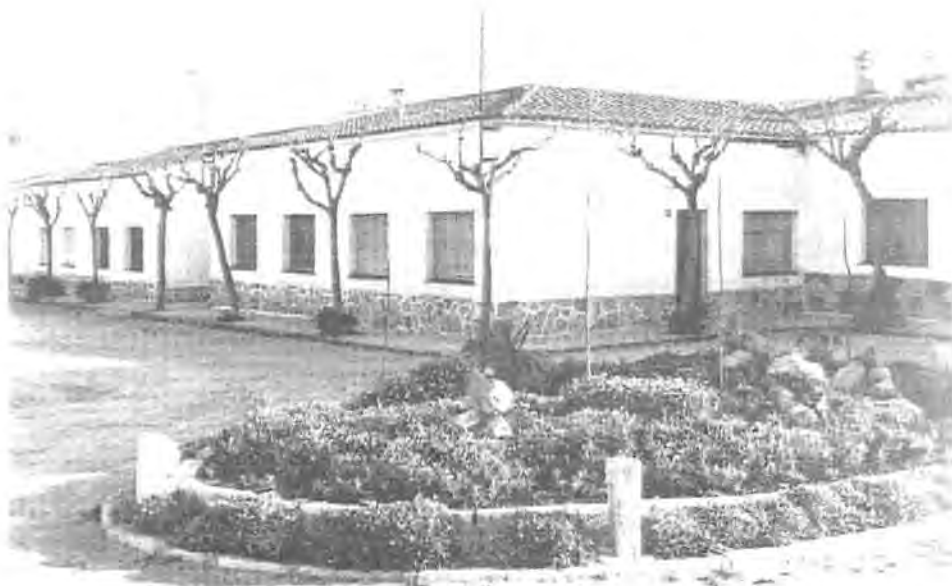
Fig. 11.2. Vista de las casas que el Patronato de Viviendas del Congreso Eucarístico construyó en Vilassar de Mar.

Otras cinco viviendas fueron adjudicadas, previo acuerdo, a personal vinculado con el consistorio de Vilassar, y sólo diez de las casas se entregaron a personas que pasaron una selección previa y que aparentemente no gozaban de ninguna recomendación. 573