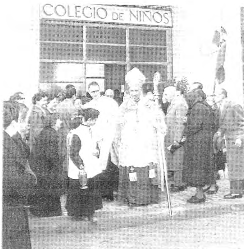
Figura 10.3. El obispo Gregorio Modrego en la bendición de la primera escuela de niños del barrio VCE-Can Ros, 1955.

Dicho organismo tenía como asesor religioso al rector de la también provisional parroquia de San Pío X. 504