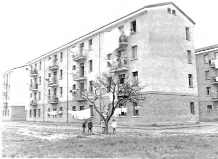
Figura 5.1. Vista de uno de los bloques de viviendas construidos por el Patronato Diocesano del Hogar en Pardinyes.

Así, a tenor de la documentación de la entidad, entre 1953 y 1957 se constata un parón en las obras que no se reactivarían hasta 1958, momento que se entregan las treinta y dos viviendas arriba mencionadas, que con el paso de los años, recibirán el nombre popular de “les cases del Bisbe “, y se empieza la construcción de las que habían proyectado para el barrio de