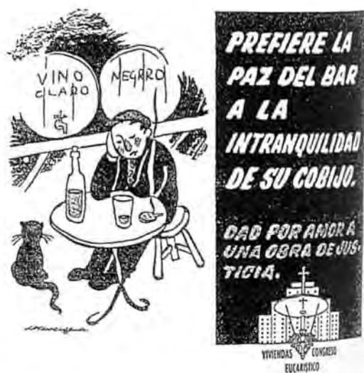
Figura 9.2. Anuncios aparecidos en la prensa gráfica para la campaña de proviendas del Congreso Eucarístico.