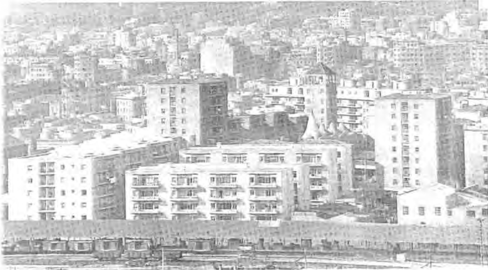
Figura 10.5 Vista de las viviendas realizadas por el Patronato en el barrio de La Bordeta.

Contando las dos iniciativas en cuestión de nueve años se construyeron quinientos noventa y tres pisos que conformaron una pequeña barriada agrupada entorno a la parroquia de San Medir ( Figura 10.5.).