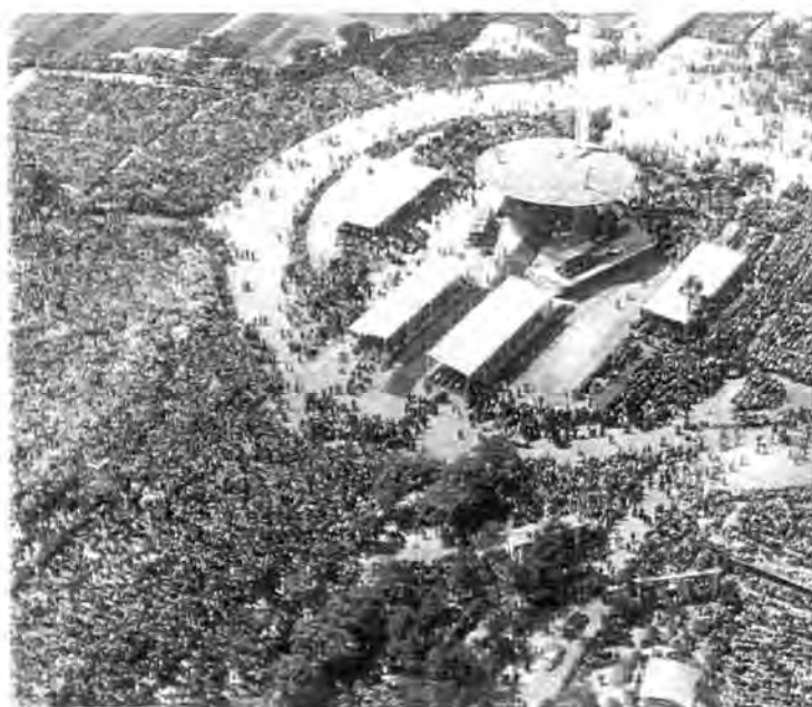
Figura 8.1. Vista de la plaza Pío XII durante la misa solemne, el 1 de junio de 1952.

aeropuerto. Concretadas con notorias mejoras de las instalaciones y las pistas y la construcción de la nueva terminal de pasajeros en la plaza de España. 342 Todas esta política de obras de remodelación y mejora se explica por la inyección económica que supuso un crédito del Ministerio de Obras Públicas valorado en más de 72 millones de pesetas. 343 Una buena parte de esta cantidad, se destino a la adecuación de los espacios del Congreso, especialmente a la zona de la Diagonal. El aprovechamiento de aquel espacio urbano se ha de entender desde dos puntos de vista. Por un lado, el ayuntamiento era propietario de buena parte de los terrenos cercanos dónde se debía construir la futura zona universitaria, y por otro lado, existía la voluntad de prolongar la Avenida Diagonal como eje vertebrador de la ciudad. Estos dos