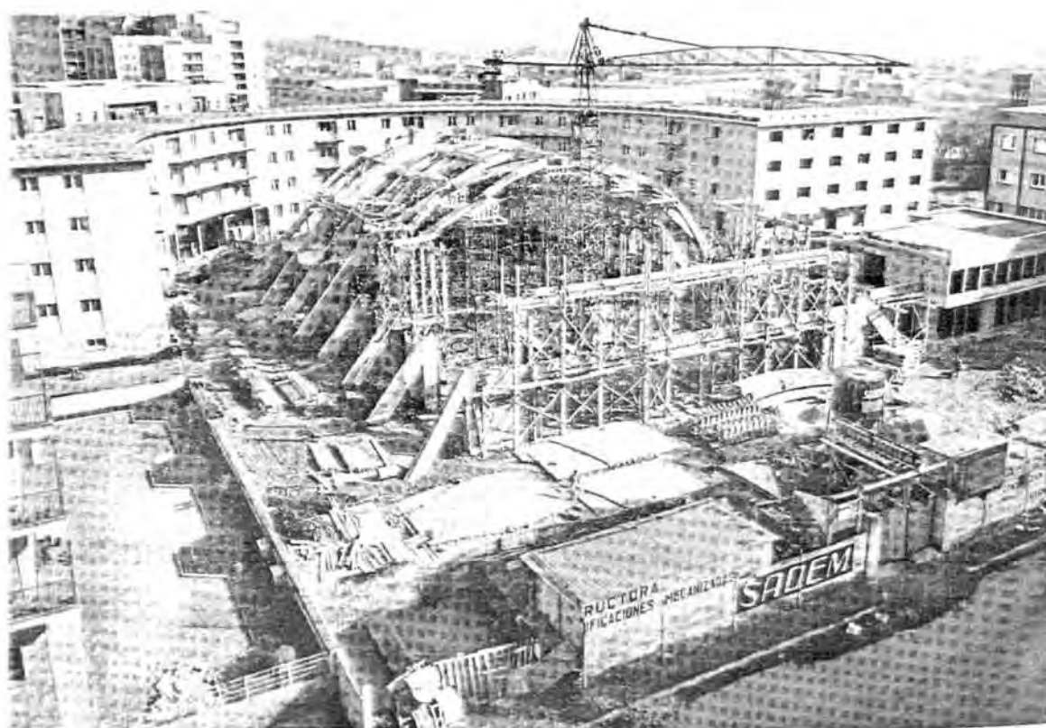
Figura 10.4. La iglesia de San Pío X en plena construcción. Su estructura recuerda los pabellones deportivos que Soteras Mauri diseñó en Barcelona y en Madrid.

personas, y de una torre de 45 metros que debería ser el campanario. El presupuesto era de 8.053.509 pesetas y vino a suponer uno de los primeros problemas del vecindario con el Patronato ya que el reparto del coste de la iglesia se hizo de la siguiente forma: el 30 por ciento debía ser sufragado por el INV, el 50 por ciento, por parte de una serie de préstamos que se solicitarían a las cajas de ahorros que ya operaban con el Patronato, y el 20 por ciento restante por parte del patronato.