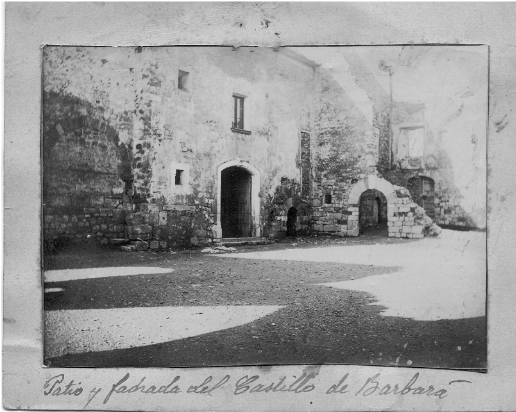
Patio y fachada del Castillo de Barbara