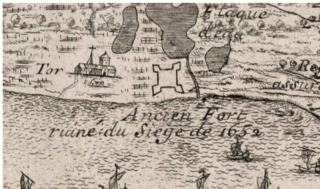
Detall de la referència del setge de 1651-1652 al gravat del setge de Barcelona de 1698