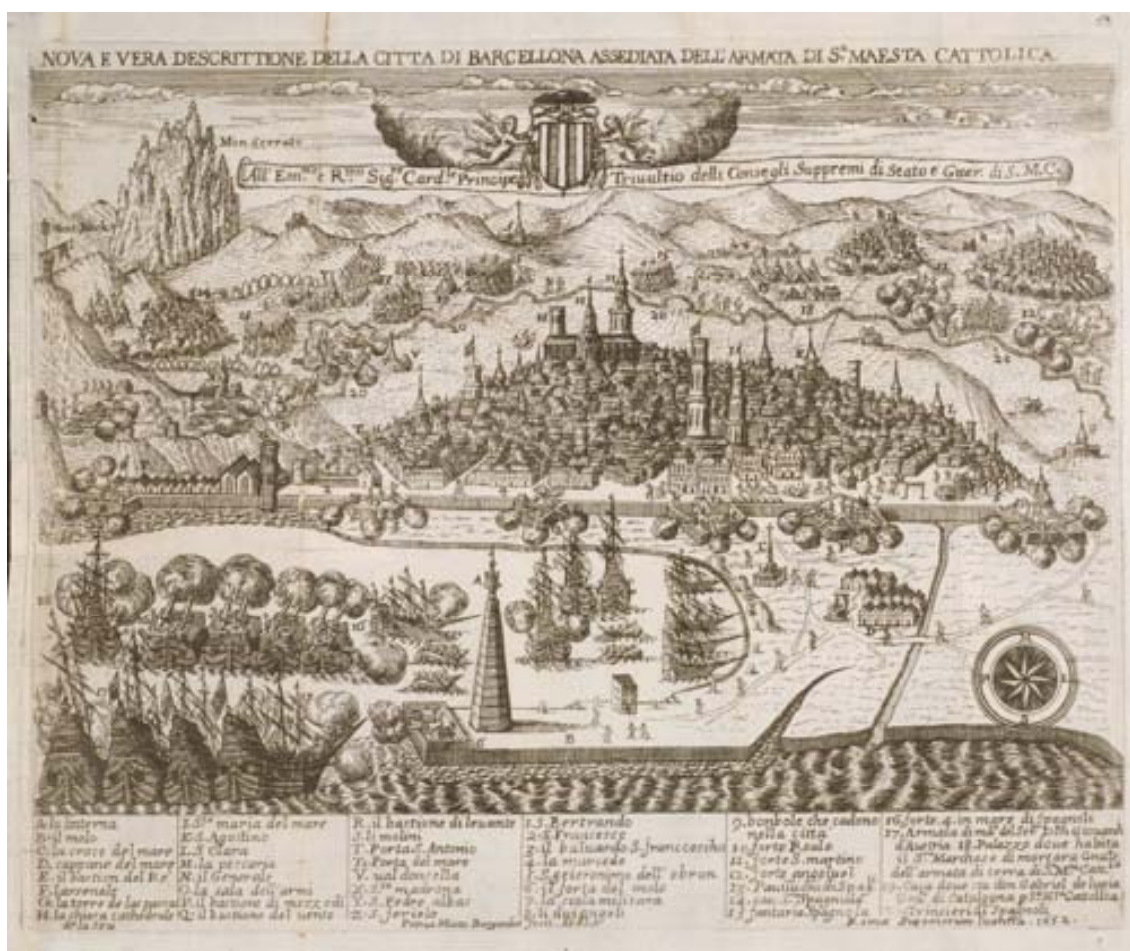
AHCB, Fons gràfics, Documents cartogràfics, El setge de Barcelona de l'any 1652.

En aquest cas l'artista se centrà, a diferència de l'anterior gravat, en la ciutat de Barcelona. En detalla els edificis i defenses més importants, tot dibuixant l'entremat urbà barceloní, sense descuidar en cap cas les tropes esteses entre les muralles i la serralada de Collserola. Fins i tot amb el número 18 indica "Palazzo dove habita il signore marchese di Mortara, generale dell'armata di terra si Sua Majestà Cattolica" i amb el 19 "Casa dove sta don Gabriel de Lupià, governatore di Catalogna, per Sua Majestà Cattolica". Cal destacar també la presència de Montserrat a l'extrem superior esquerre de l'obra, segurament per l'especial devoció dels catalans per la muntanya i el seu santuari. Així mateix, Miotte també se centrà en mostrar el bombardeig marítim i terrestre de l'armada hispànica sobre Barcelona i la defensa aferrissada dels soldats catalans.