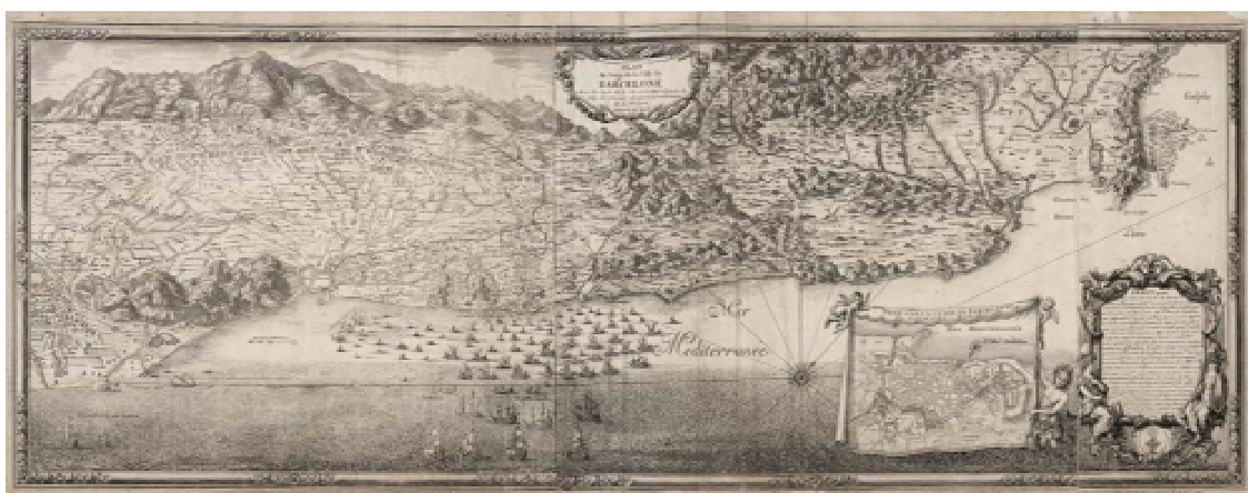
AHCB, Fons gràfics, Documents cartogràfics, El setge de Barcelona de 1698.

El darrer gravat se centra en el setge de Barcelona de 1698 amb el títol “ Plan du siège de la ville de Barcelone avec la carte de la côte de la mer depuis le Cap de Cervère jusqu’aux environs de Llobregat. Dedié au Roy. 1698 ”. El mapa és una còpia de l’anterior gravat de Beaulieu per part de Johann Stridbeck (1665 - 1714), el qual aportà algunes modificacions en la descripció i la disposició de l’exèrcit de terra i l’armada. 57 El fet que es reculli aquesta obra és la presència dins del mapa d’una referència al setge de 1651-1652, la qual cosa demostra el pes dels fets durant tota la segona meitat del segle XVII. 58 Entre Barcelona i Badalona, prop de Sant Martí, l’autor cita el fort de Sant Martí, el qual fou destruït l’any 1652: “Ancien fort ruiné du siège de 1652”.