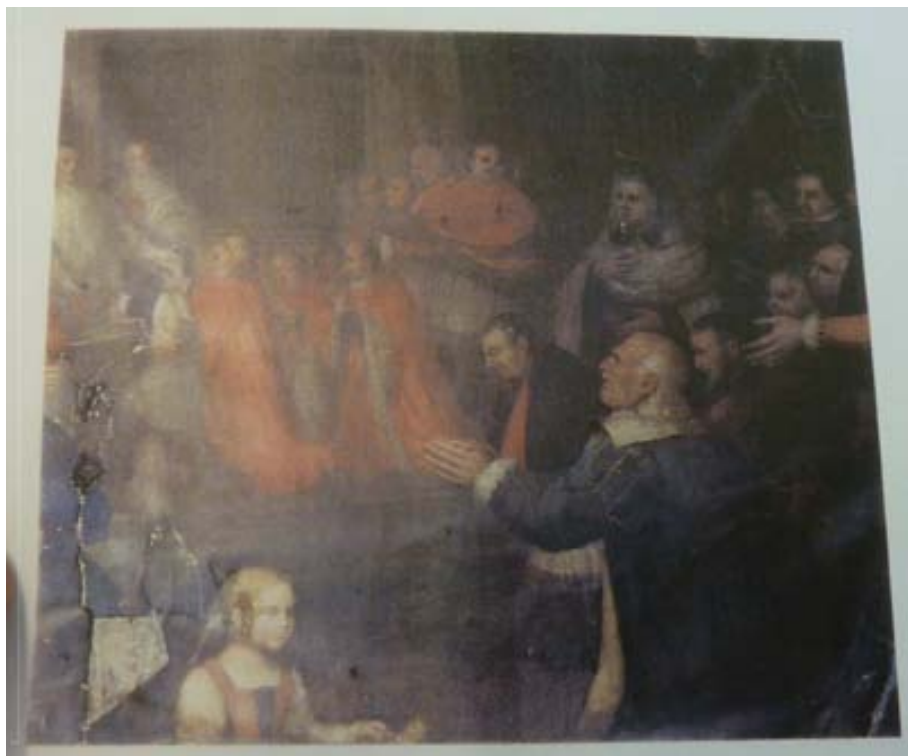
Ofrena de les claus de la Ciutat Comtal a la Puríssima Concepció. Catedral de Barcelona