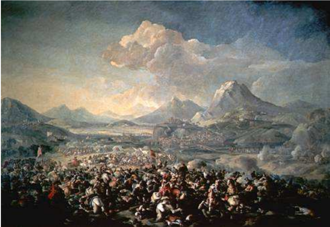
Gran battaglia presso Barcellona. Galleria Corsini, Florència.

A la Gran Battaglia presso Barcellona es presenta una batalla en un escenari imaginari que poca cosa té a veure amb els contorns de la ciutat de Barcelona. Tot i la situació general plasmada per Reschi, destaquen alguns episodis de la lluita com la confrontació de dos cavallers on un d'ells cau a terra, o bé la figura del trompetista que es mou vertiginosament entre els encontres cos a cos.