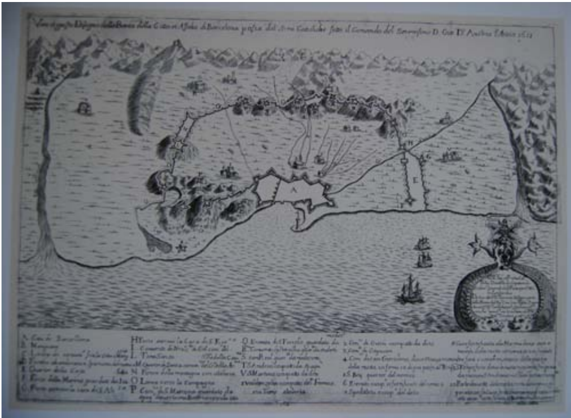
El setge de Barcelona l'any 1651. Atlas de Barcelona de Ramon Soley, gravat 24.

La tercera obra realitzada en motiu del setge fou l'estampa de Giovanni Antonio Franco realitzada a Milà l'any 1651 sota el títol de "Vero et giusto disegno della pianta della citta et assedio di Barcelona posta dal'armi cattoliche sotto il comando del serenissimo Don Giovanni d'Austria. L'anno 1651" i dedicat a Danielle de' Capitani di Scalve al marge inferior dret a sobre de la llegenda composta per 32 descripcions de l'A a la V i de l'1 al 10. 55 En aquest cas el gravador efectuà una obra de caràcter més senzill sense tants detalls ni accions bèl·liques.