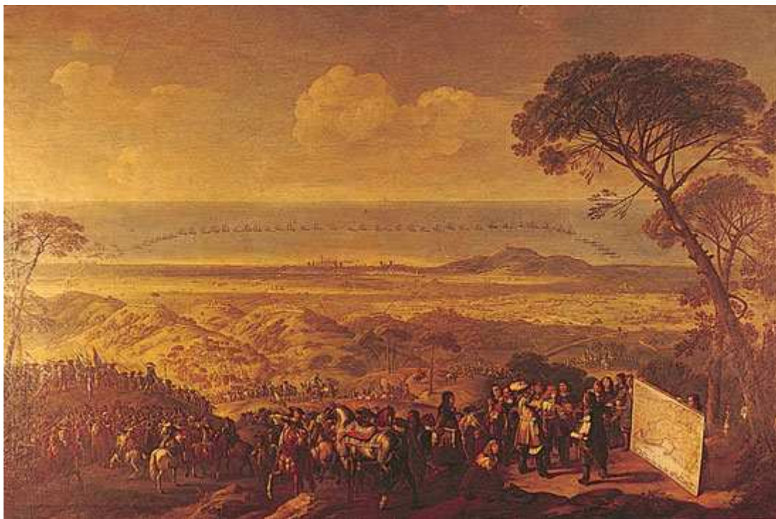
L'Assedio di Barcellona. Galleria Corsini, Florència.

A l'escena de l' Assedio di Barcellona apareix en un primer pla, però en un petit espai, Joan Josep d'Àustria dirigint i discutint les operacions sota d'un pi des del Tibidabo junt amb el marquès de Mortara i la resta d'alts comandaments del seu exèrcit per a llançar l'ofensiva per a fer capitular la Ciutat Comtal l'any 1651 –data que es visualitza en el plànol que assenyala el príncep. La resta del quadre Reschi el dedicà a representar el territori del Pla de Barcelona i la disposició terrestre i marítima de les forces militars de Felip IV que assetjaven la capital catalana, les quals destaquen gràcies a la vista en perspectiva que utilitzà l'autor per a dibuixar-les, un tret característic de la tradició cartogràfica militar nòrdica. 64 Així, Reschi desmostrà per sobre de tot la seva qualitat com a pintor de paisatges